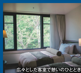
広々とした客室で憩いのひととき