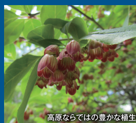
高原ならではの豊かな植生