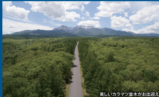
美しいカラマツ並木がお出迎え